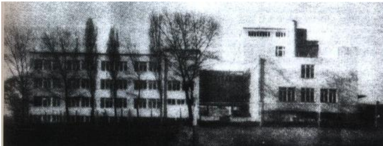
Př. č. 11: Masarykova léčebna – „Dům útěchy“ v roce 1935