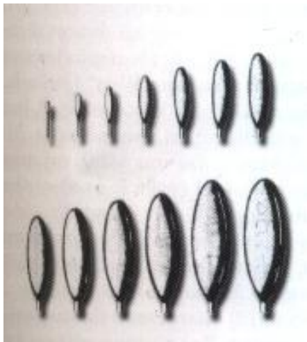
Př. č. 7: Olivové dilatační sondy