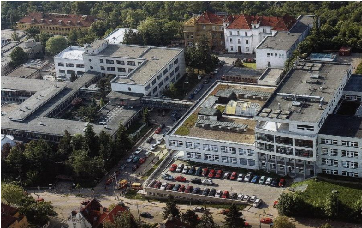
Př. č. 14: Nynější Masarykův onkologický ústav