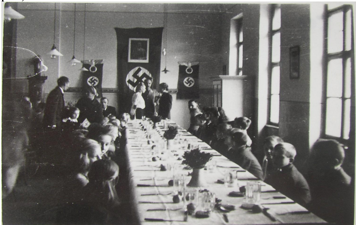
Interiér tzv. „hnědého domu“, č.p. 102, který Němci využívali ke svým kulturním účelům