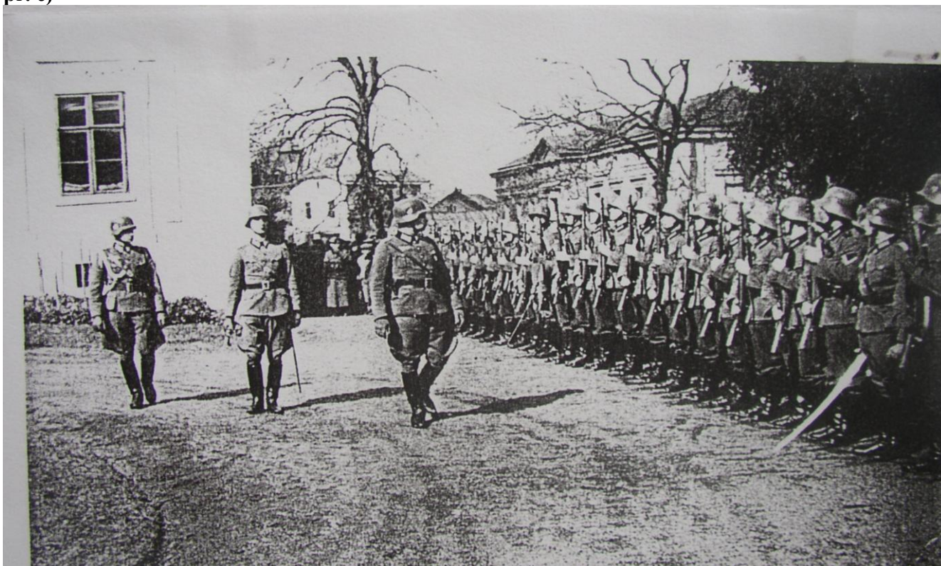
Německé vojsko v areálu zámku v Židlochovicích