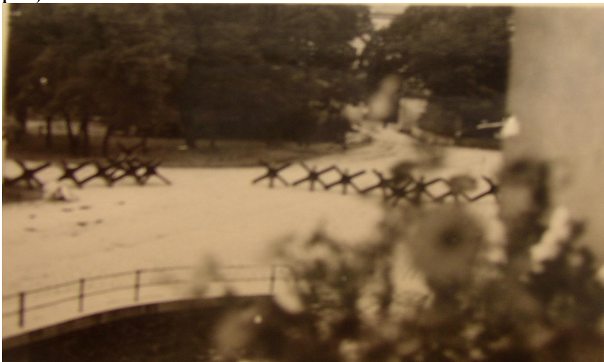
Zátěrasy na druhé straně mostu směrem k zámku postavené pěším plukem Arko 23. listopadu 1938